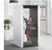
telephone cube 2.0