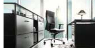
modul space black edition