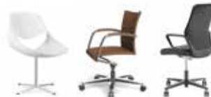
Little Perillo XS