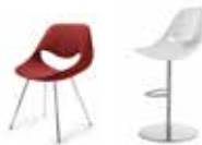
Little Perillo XS