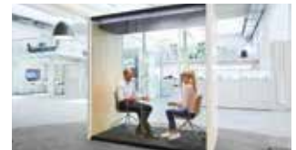
dialogue cube 2.0